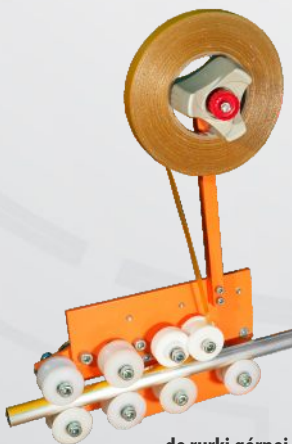
do rurki górnej