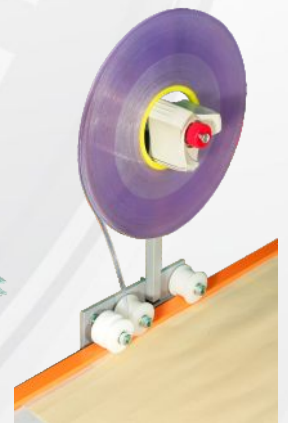
podajnik taśmy sztywnej