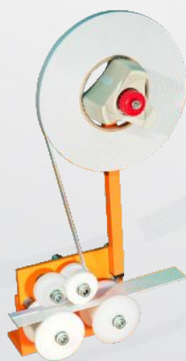
do prowadnicy płaskiej